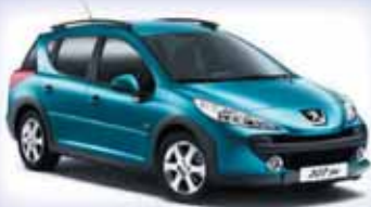
Peugeot 207 SW